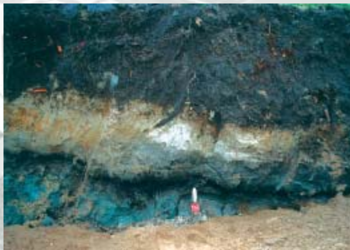
Her ses nogle af aflejringerne. Det nederste sorte lag er Allerød-laget med de mange planterester. Derover ses lysere lag fra Yngre Dryas, som er en kuldeperiode.

Oplysningerne fra den gamle sø under Netto i Skævinge om plantelivet i Allerød-tiden er betydningsfulde nok til, at de sandsynligvis vil indgå i kommende videnskabelige artikler om denne periode.