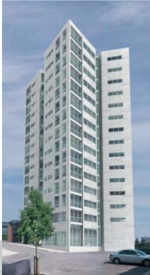
Vejles nye vartegn – Den hvide Facet – beløber sig til ca. en kvart mia. kr.

Iflg. KPC Byg er det alle involverede parter intention, at huset skal blive en arkitektonisk perle og et brugsmæssigt hus med materialer af høj kvalitet og med en unik indretning. Bl.a. er alle lejligheder i forbindelse med opholdsrummet udstyret med en loggia, hvor store dele af glasfacaden kan åbnes, så loggiaen afhængigt af vejret kan fungere skiftevis som altan, udestue eller en del af opholdsstuen.