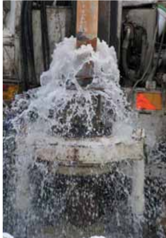
Sådan ser det ud, når FG's 100 kubikmeter pumper driver såkaldte cuttings op fra 35 meters dybde.

- Boringerne blev udført med direkte skylning i 12 tommer med rullemejsel. Vi hentede vandet til pumperne fra det nærliggende havnebassin og recirkulerede det via to 30 kubikmeters containere. Efterfølgende har vi monteret 165 mm filterrør i de åbne boringer. Franck Geoteknik opnåede at få 5 gange mere vand ud af sine boringer, end nogle nærliggende boringer, der var udført i "første omgang"