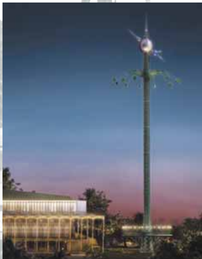
Det 80 meter høje Himmelskib er tematiseret med udgangspunkt i Tycho Brahes rumunivers.

Etableringen af Himmelskibet krævede to undersøgelser, hvor der blev boret til 14 meter under terræn og til top af kalklaget. Himmelskibet er med sine 80 meter verdens højeste karrusel. Det er en blanding af en høj udsigtsattraktion og en klassisk sving-karrusel (med en hastighed på op til 70 km i timen), og gyset kombineres med følelsen af at flyve. Himmelskibet har en kapacitet på ca. 960 gæster i timen.